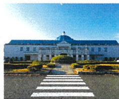
よかわコース [クラブハウス]