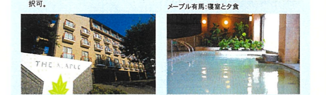
メープル有馬:温泉

(代金に含まれるもの) 宿泊代、ゴルフプレー代 (割増代、利用税、振興基金、昼食代は除く)、レンタカー代 (ヤリス、マツダ2クラス)。※レンタカーの有無は選択可。※アップグレードも追加料金可。 ■レンタカー発着地:神戸空港、新神戸駅、伊丹空港。 ■対象ゴルフ場:花屋敷ゴルフ倶楽部よかわコース (2B割増無)、有馬カントリー倶楽部。※有馬ロイヤルゴルフクラブ (ロイヤルコース)、北六甲カントリー倶楽部 (東・西)、美奈木ゴルフ倶楽部、武庫ノ台ゴルフコースも選択可。