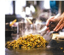
本場で食べたい「そばめし」。