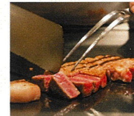
人気の「神戸ビーフ」。