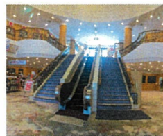
よかわコース [ロビー]