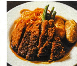
どこもレベルが高い「洋食」。