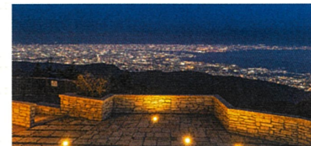
六甲ガーデンテラス。