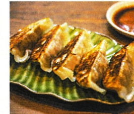
神戸独特の「味噌だれ餃子」。

神戸と言えは神戸ビーフや南京町(中華街)に代表されるグルメの街。美味しいものがあるという目移りしてしまう。そんなグルメのオールドスタイルでもゴルフと一緒に堪能してみたいものもおすすめだ。「味噌だれ餃子」は、神戸独特で店ごとにタレが違いクセになりそうな味。「そばめし」は全国的にも知られるが、「本場の味」を一度体験してみたい。早くから西洋文化の影響を受けた神戸は「洋食」も人気。老舗から新店まで個性溢れるお店が点在する。ゆったりと景色でも眺めながら神戸グルメを楽しみたいなら「TENRAN CAFE」がイチ押し。六甲の絶景が広がる中で、地ビールや神戸ワインに合わせて地元の美味を味わい尽くす。そんな贅沢な時間が心を癒してくれる。ラウンド↓六甲山↓ホテルの移動は十分可能で、昨年北海道から訪れたゴルファーたちも実際に楽しみ、大好評だったという。せつかく神戸を訪れたなら、ゴルフだけでなく、ご当地グルメを堪能してみたい。